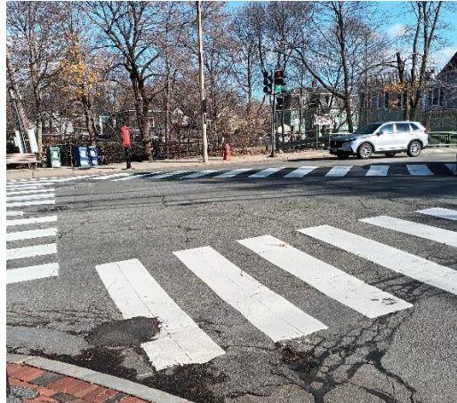
Newton, Massachusetts, USA. Het is wel lopend maar zijn de kortste oversteken. Het kan dus zeker op een goede manier!

Wij in Oosterhout gaan dat beter doen! Wij leggen de rode fietspadloper uit over de gehele kruising, niemand hoeft dan meer te twijfelen of het kan. De toegangen tot de reeds bestaande fietspaden worden ruimer gemaakt en zo fietsen we relaxed door. Oosterhout als voorbeeld!